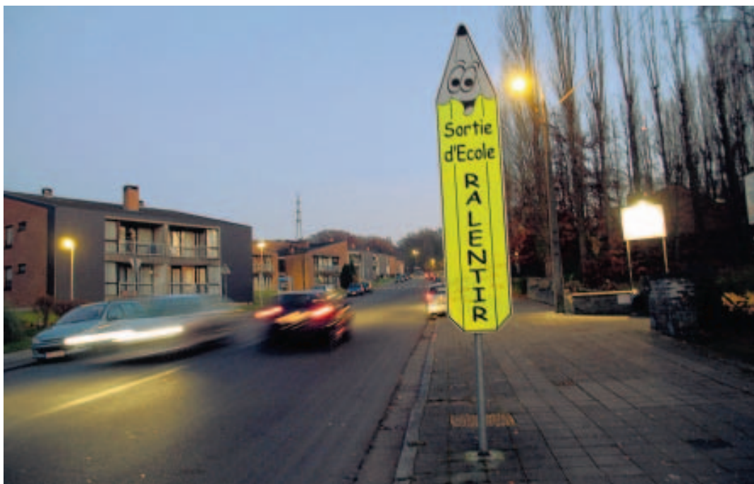
Kevin et ses camarades traversaient l'avenue du Centenaire, face à l'IPES.